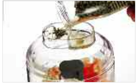
Ajout de solide par la fente du couvercle.