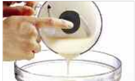
Tenez le couteau en versant le contenu.