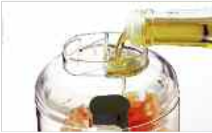
Ajout de liquide par le compartiment liquides du couvercle.