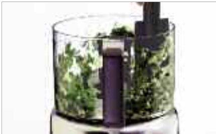
Si nécessaire rabattez les aliments avec la spatule et donnez 2/3 pulsions.